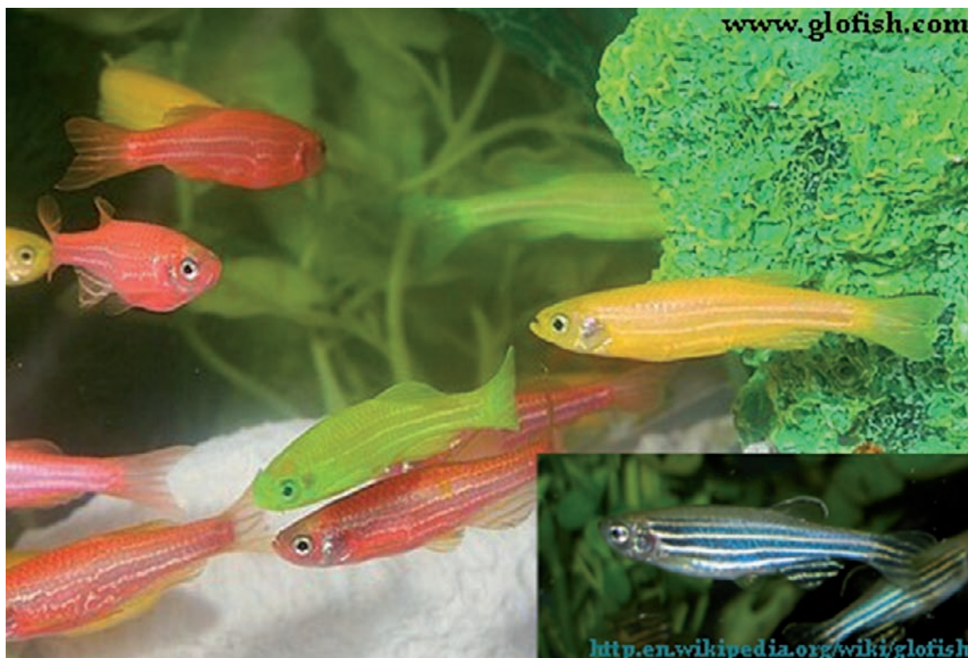
Figura 2. Paulistinha ( Danio rerio ) com genes de água-viva e corais marinhos inseridos em seu genoma, conferindo bioluminescência nas cores vermelha, verde e laranja (no canto inferior direito, sua coloração natural). O funcionamento de um gene de espécie tão diferente em outra é uma forte evidência de que todos os organismos vivos descendem de um ancestral comum que possuía DNA com herança genética.

Com o aumento do conhecimento sobre o funcionamento do código genético universal e da similaridade desse código entre as diferentes espécies, hoje os cientistas são capazes de desenvolver uma verdadeira engenharia genética. Por exemplo, os cientistas isolaram genes que codificam proteínas fluorescentes do genoma de águas-vivas e corais e os inseriram no genoma do peixe paulistinha ( Danio rerio ). Esses genes codificam proteínas que absorvem e, posteriormente, emitem luminosidade verde, vermelha e laranja nesses animais geneticamente modificados, que passam a brilhar quando expostos à luz (Figura 2). Outro exemplo de engenharia genética foi a inserção do gene da insulina humana no genoma da bactéria Escherichia coli (que vive naturalmente no intestino humano). A maquinaria celular da bactéria passa a produzir o produto do gene humano. Dada a facilidade de manipulação de E. coli em laboratório e sua atividade celular muito acelerada, o homem gerou uma “fábrica natural” para produção de insulina, ajudando milhões de diabéticos no mundo.