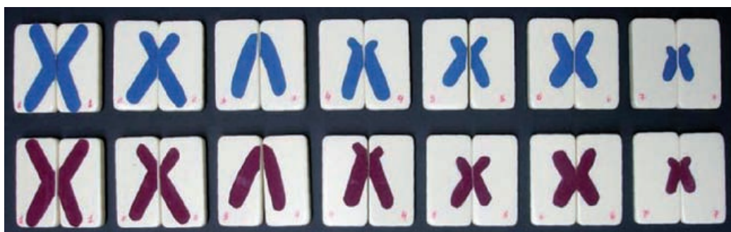
Figura 1: Modelo básico representando 2n = 14 duplicado (configuração da metafase). No exemplo aqui fornecido, o cromossomo 1 é metacêntrico grande, o 2 é submetacêntrico grande, o 3 é um telocêntrico grande, o 4 umacrocentrico grande, o 5 é submetacêntrico médio, o 6 é metacêntrico médio e o 7, um acrocêntrico pequeno.

Este modelo pode ser montado para diferentes genomas, diferentes ploidias e cromossomos até um máximo de 2n= 14 utilizando um jogo de dominó. A opção de trabalhar com um número menor de cromossomo pode ser adaptada, dependendo do número de estudantes e do tempo disponível para a execução da prática, discussão e síntese dos resultados.