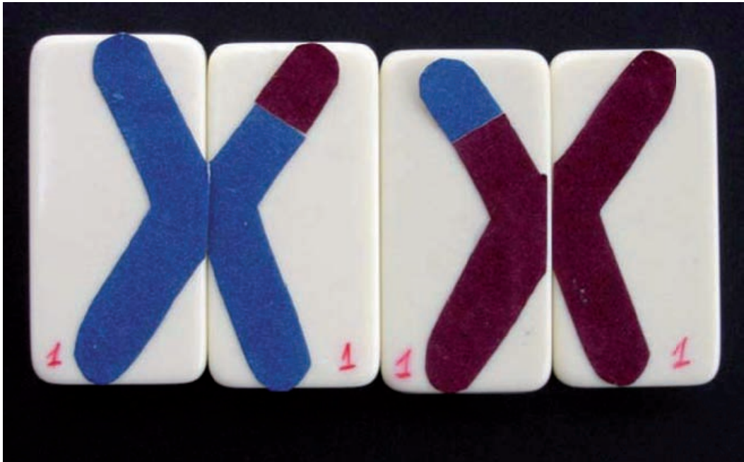
Figura 2: Modelo de um par de homólogos representando uma simulação de um crossing-over.