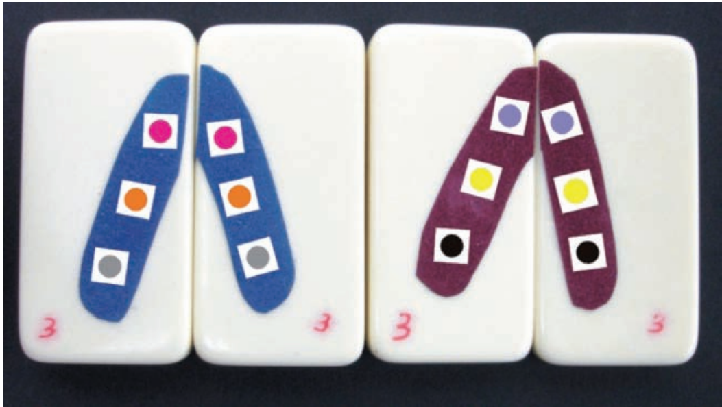
Figura 3: Modelo de um par de homólogos representando a simulação de três locos em heterozigose (alelos rosa e roxo, amarelo e laranja e preto e cinza).